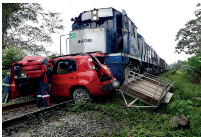
Figura 2 - Acidente ocasionando a morte de uma mulher de 53 anos, onde um automóvel foi atingido e arrastado por um trem, em Morretes, no litoral do Paraná.