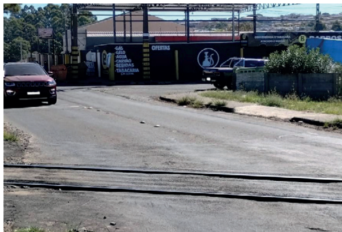
Figura 1 - Passagem de nível sem sinalização, com a presença de anúncios próximo a transposição da linha férrea, promovendo a desatenção do condutor.

Em algumas situações, infrações de trânsito, outras de sinalização insuficiente. Além disso, em certos pontos, é alarmante a presença de anúncios comerciais junto à sinalização de trânsito, o que compromete gravemente a segurança do condutor: