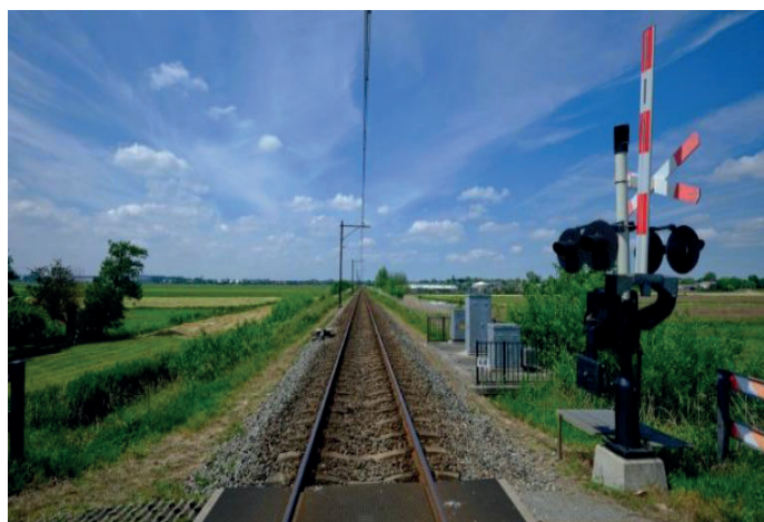
Figura 6 - Imagem de uma Tecnologia criada recentemente, conhecida como a passagem em nível Vision Computer, para ajudar a evitar acidentes e aumentar a segurança nos cruzamentos entre trens e veículos automotivos.