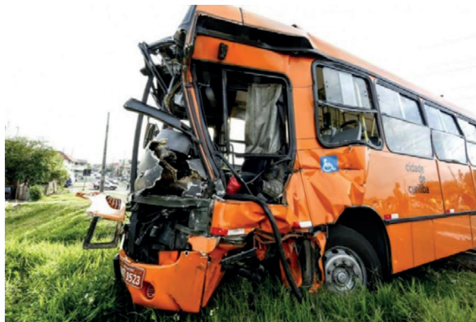
Figura 4 - Acidente com ônibus de transporte coletivo e um trem, onde ao menos 25 pessoas ficaram feridas, entre elas o motorista do ônibus que teve uma fratura de fêmur, no bairro Cajuru, Curitiba Paraná.