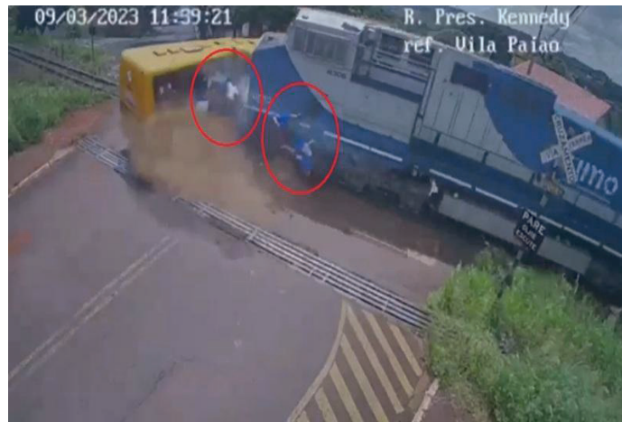
Figura 3 - Acidente entre um trem e um ônibus escolar que deixou duas meninas mortas e diversas crianças feridas, em Jandaia do Sul, norte do Paraná.